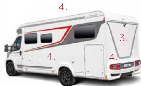
(bilden här är Tourer T 660 G)