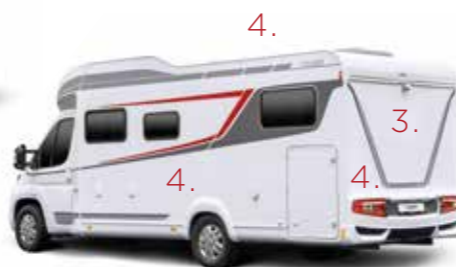
(bilden här är Tourer H 730 G)